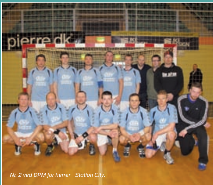
Nr. 2 ved DPM for herrer - Station City.

I Herre A – oprykning blev begge kampene hurtigt afgjort, i det Vestegnen vandt med 18-9 over Amager og Sydsjælland vandt 14-8 over Midt og Vestsjælland 2. Stort tillykke til Vestegnen og Sydsjælland - vi glæder os til at se Jer bide skeer med Eliterækken.