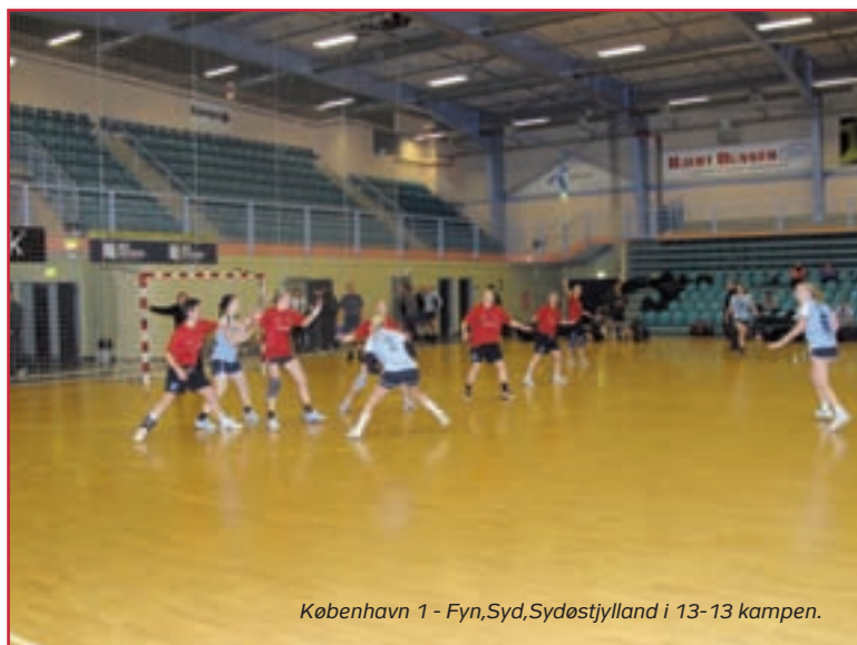
København 1 - Fyn,Syd,Sydøstjylland i 13-13 kampen.

København 1 skulle i deres anden kamp møde Fyn/syd/sydøstjylland. Kampen startede meget tæt, men Fyn/syd/sydøstjylland trak fra København 1 og kom foran med hele 5 mål. Ved godt forsvarsspil lykkedes det København 1 at hente Fyn/syd/sydøstjylland, og kampen endte 13-13. Fyn/syd/sydøstjylland blev dermed nr. 1 i pulje 2 på bedre målscore. Dagens sidste damekamp mellem Nordjylland og Vestegnen, blev en mere jævnbyrdig affære, hvor holdene fulgtes pænt ad gennem hele kampen, der dog blev skæmmet af en del tekniske fejl. Kampen sluttede med sejr til Nordjylland på 11-9, som dermed blev nr. 1 i pulje 1.