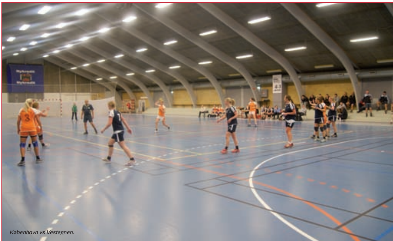
København vs Vestegnen.