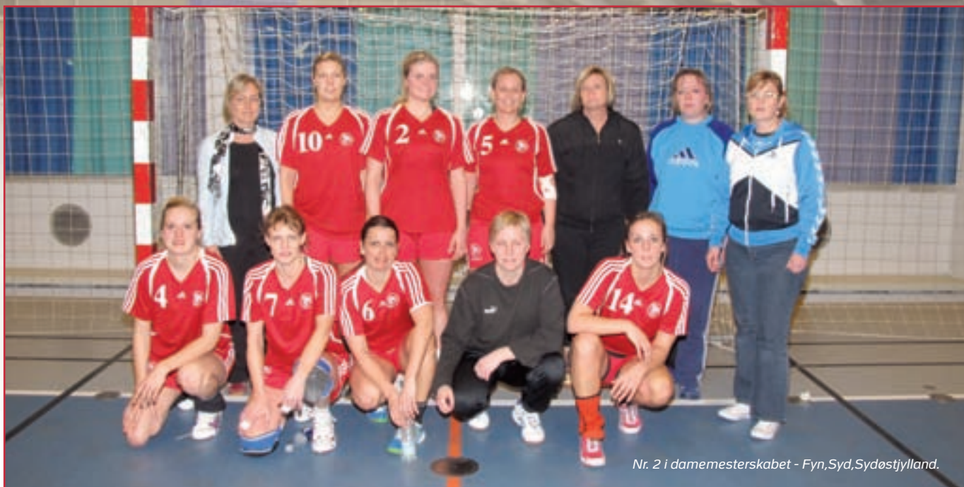
Nr. 2 i damemesterskabet - Fyn,Syd,Sydøstjylland.

København 1 skulle i deres anden kamp møde Fyn/syd/sydøstjylland. Kampen startede meget tæt, men Fyn/syd/sydøstjylland trak fra København 1 og kom foran med hele 5 mål. Ved godt forsvarsspil lykkedes det København 1 at hente Fyn/syd/sydøstjylland, og kampen endte 13-13. Fyn/syd/sydøstjylland blev dermed nr. 1 i pulje 2 på bedre målscore. Dagens sidste damekamp mellem Nordjylland og Vestegnen, blev en mere jævnbyrdig affære, hvor holdene fulgtes pænt ad gennem hele kampen, der dog blev skæmmet af en del tekniske fejl. Kampen sluttede med sejr til Nordjylland på 11-9, som dermed blev nr. 1 i pulje 1.