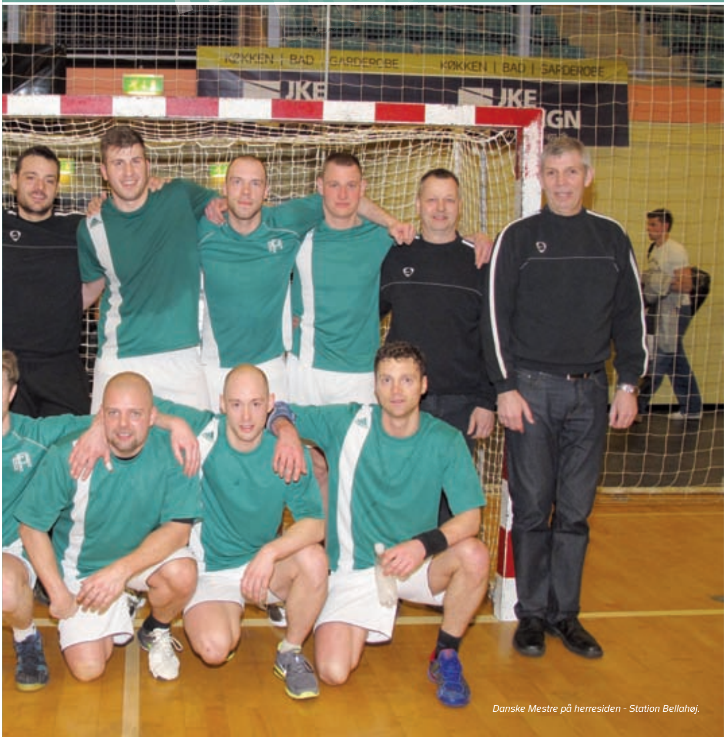
Danske Mestre på herresiden - Station Bellahøj.