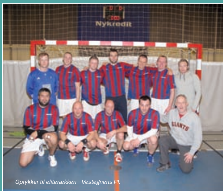
Oprykker til eliterækken - Vestegnens PI.