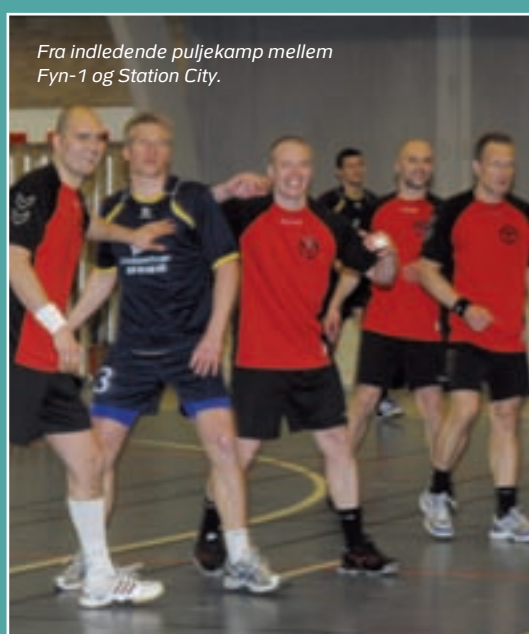
Fra indledende puljekamp mellem Fyn-1 og Station City.