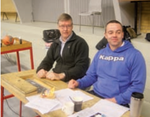
Tidtager border under Nordsjælland - Færdslen kampen.