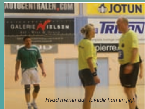
Hvad mener du - lavede han en fejl.

Sydøstjylland skulle spille anden kamp mod Bellahøj, og skulle således vinde - helst stort for stadig at bevare chancen for DM. Sydøstjylland lagde da også ud med føring på 6-1, hvorefter man gik i stå og lukkede Bellahøj ind i kampen. Dette udnyttede Bellahøj til en halvleg føring på 8-6. I anden halvleg øgede Bellahøj føringen til 14-10 efter 9 minutter. Sydøstjylland kom godt igen og efter 13 min fik de reduceret til 15-16. De to hold fulgtes herefter ad til slut resultatet 21-20 til Bellahøj.