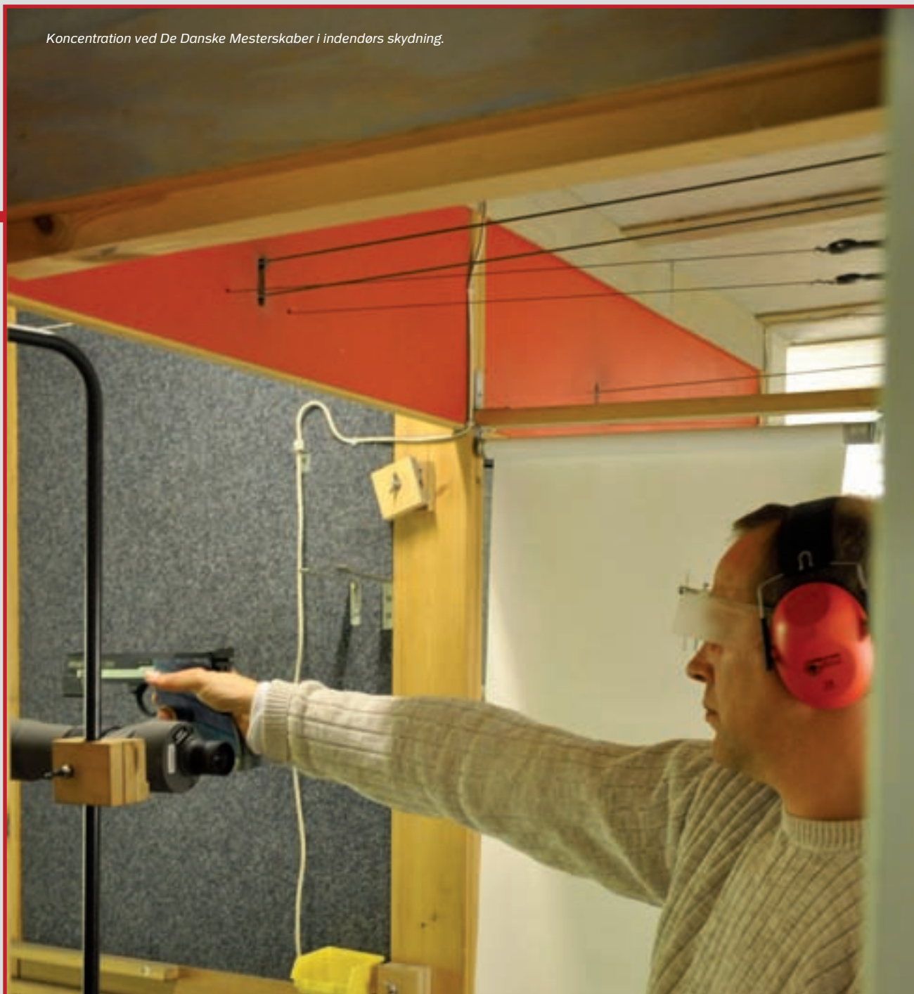
Koncentration ved De Danske Mesterskaber i indendørs skydning.