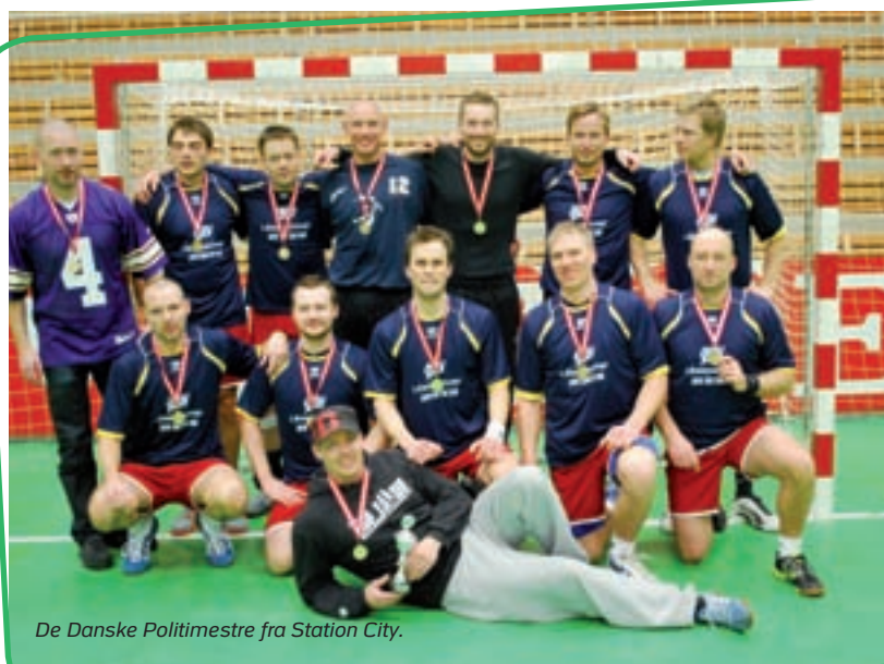
De Danske Politimestre fra Station City.