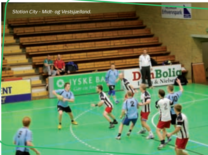
Station City - Midt- og Vestsjælland.