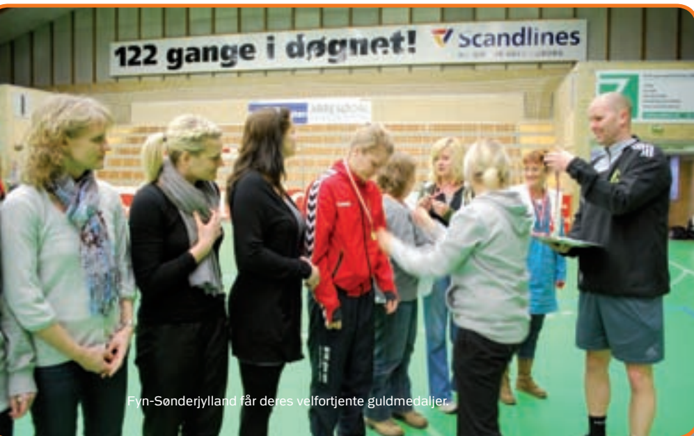
Fyn-Sønderjylland får deres velfortjente guldmedaljer.

Af Søren Damgaard, Rigspolitiet, medlem af håndboldudvalget.