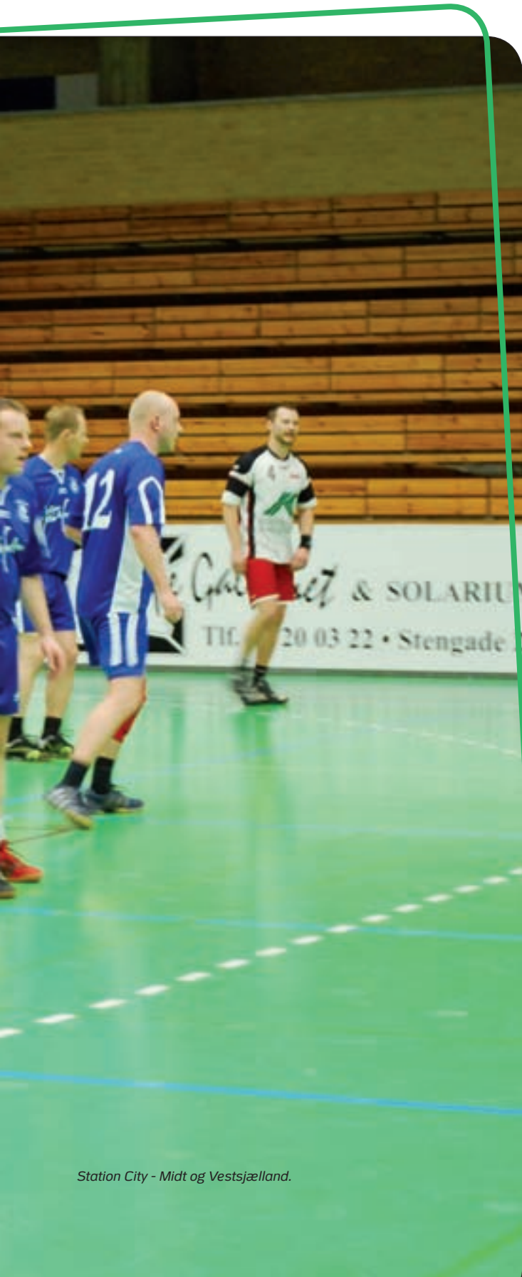
Station City - Midt og Vestsjælland.

Det er igen blevet tirsdag i uge 10, kl. er 08.30 og rammerne er dette år en halvkold Helsingør hal. De to første hold står klar på banen og dommeren har fløjtet op - DM i politihåndbold er i gang.