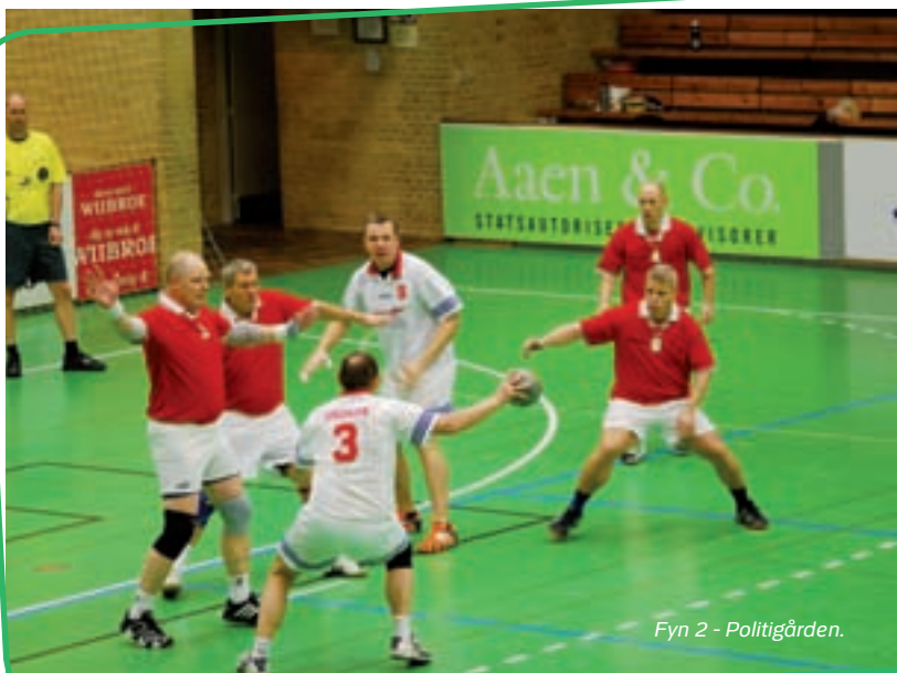
Fyn 2 - Politigården.