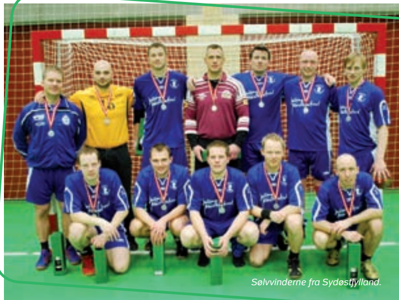
Solvinderne fra Sydøstjylland.