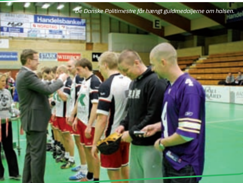
De Danske Politimestre får hængt guldmedaljerne om halsen.

Anden kamp om oprykning mellem Østjylland 2 og Færdselsafdelingen, blev efter en lidt rodet forestilling vundet af færdselsafdelingen med 13 – 10. Når så den højere matematik blev taget i brug, var dette nok til at Færdselsafdelingen var rykket op i Eliterækken til næste år – stort tillykke.