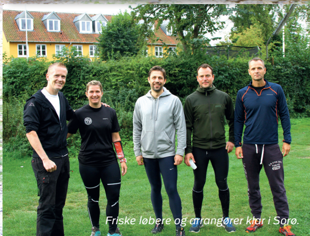
Friske løbere og arrangører klar i Sorø.