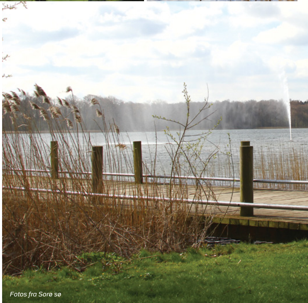
Fotos fra Sorø sø