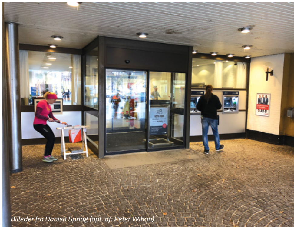
Billeder fra Danish Spring

Som vi erfarede i foråret med "Den fynske sprintcup", så har sprintløb vundet mere og mere indpas i Danmark. Det er der flere gode grunde til blandt andet den dimension, at det er sjovt, når der kommer lidt ekstra fart på, og de hurtige beslutninger skal tages.