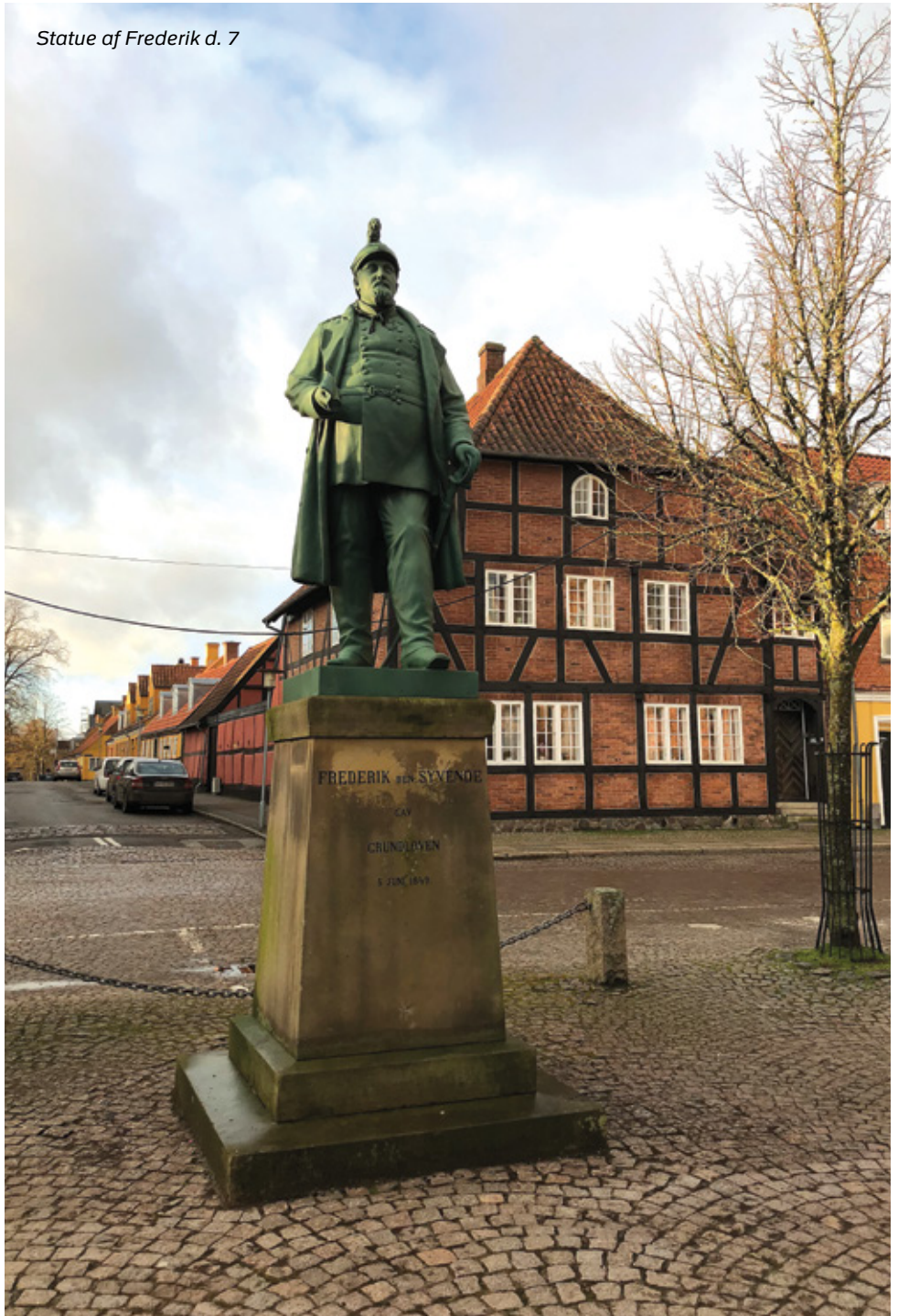
Statue af Frederik d. 7