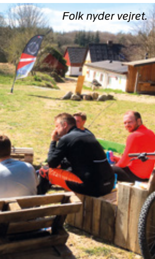
Folk nyder vejret.