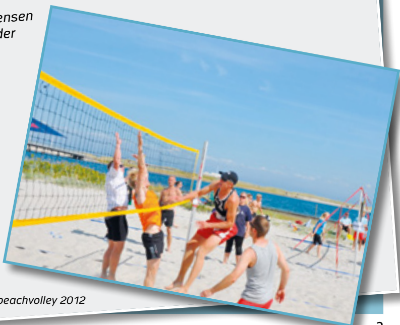
Fotos fra beachvolley 2012