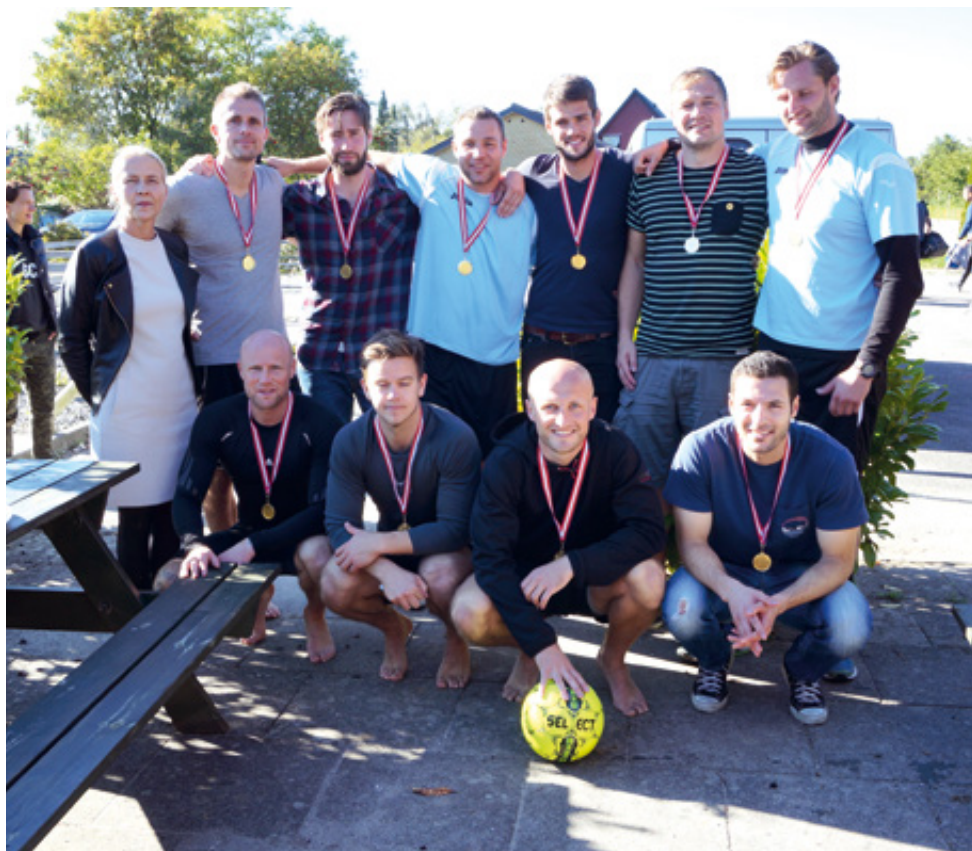
Station Bellahøj - danske politimestre 2015