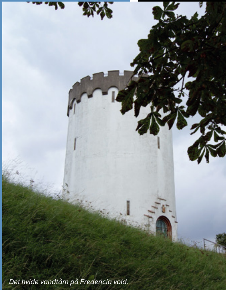
Det hvide vandtårn på Fredericia vold.

inde for voldene, har hverken tårne eller spir. Dette for at fjenden uden for voldene, ikke skulle kunne bruge de høje tårne som sigtemærke for deres kanonild og beskydning af byen. Fredericia har flere gange i tidens løb været løbet over ende af fjentlige soldater. Det være sig både svenskere, tyskere og østrigere. I 1849 havde den slesvig-holstenske hær belejret Fredericia, og det førte til, at den danske hærledelse besluttede