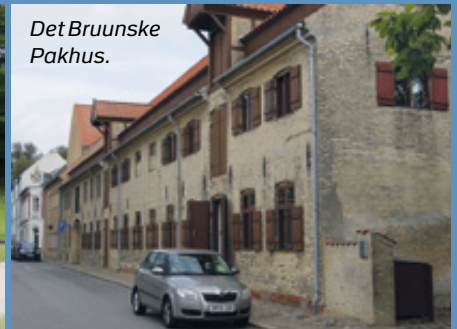
Det Bruunske Pakhus.