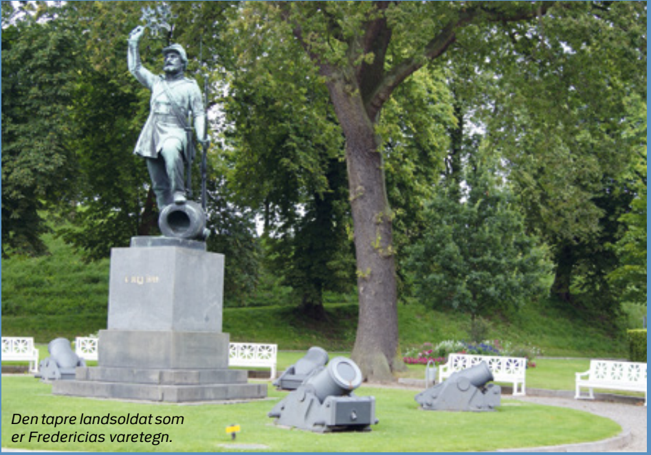
Den tapre landsoldat som er Fredericias varetegn.