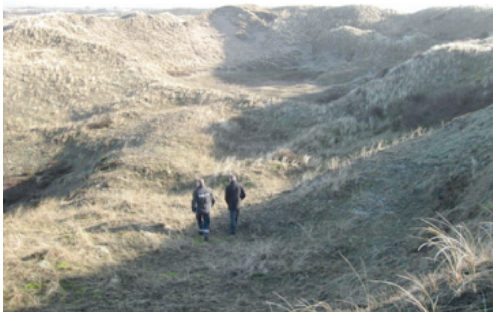
Feltskydebanen i Store Klit med Sømærket i baggrunden.

Feltskydebanen i Store Klit. Høien (Gl. Skægen) 2012