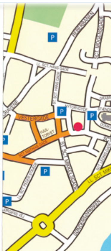
Latinerhaven, Sct. Mogens C

Nærmest lindetræsækken blev det eksisterende terræn bevaret, men i øvrigt undergik haven ret omfattende reguleringer. Niveauforskellene blev optaget ved brug af støttemure af kampesten omkring de mindre terrasseformede haverum. Haven blev således inddelt i flere mindre haveafsnit med hver deres karakter. Foruden anlæggelsen af Latinerhaven har Rasmus Brostrøm tegnet smedjejernslågerne til havens tre indgangspartier.