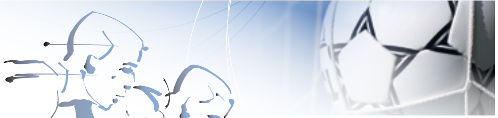
Arkivfotos fra 2012