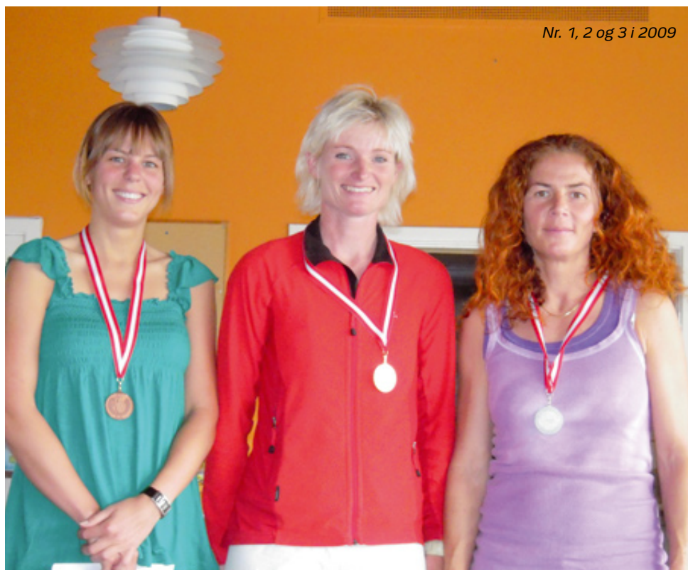
Nr. 1, 2 og 3 i 2009

Der løbes naturligvis jf. færdselsreglerne.