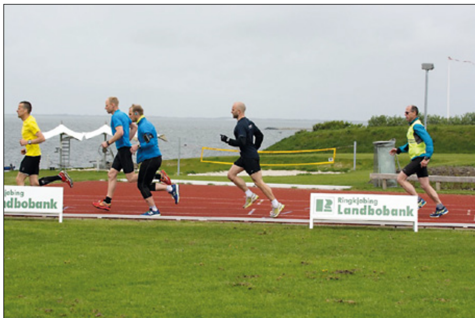
Arkivfotos fra Fjordløbet.