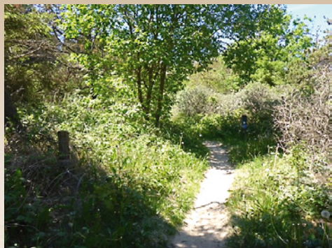
Hærvejen på vej til Rubjerg Knude