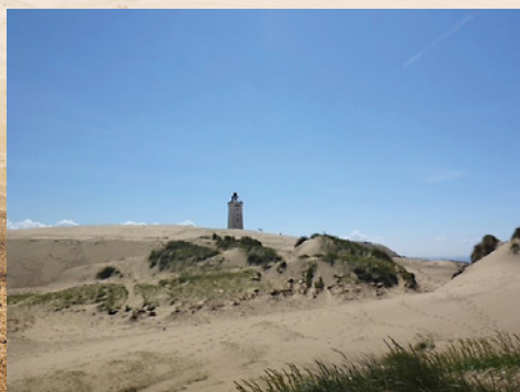
Rubjerg Knude Fyr set fra Nordsøstien