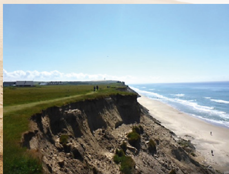
Nordsøstien mellem Rubjerg Knude og Lønstrup