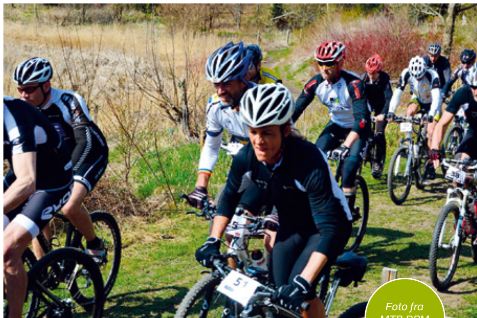
Foto fra MTB DPM 2013

Årets danske politimesterskaber afvikles på og omkring det smukke Høgsbjerg (Albertslundbjerget) ved Tueholmsøen ca. 1 km syd for politigården i Albertslund.