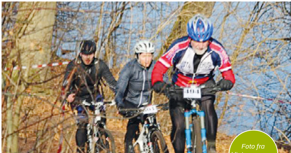
Foto fra Vintercuppens 5. afd.