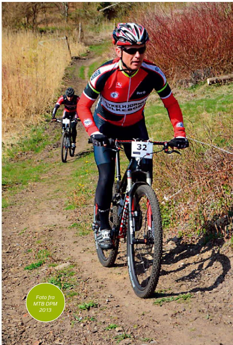
Foto fra MTB DPM 2013