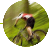
Foto fra Vintercuppens 5. afd.