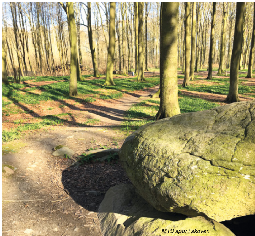
MTB spor i skoven

i en forholdsvis kraftig type (Lyngby-type) – op til 14 cm lang, en kortere og spinklere type samt en kort type. Selv de korteste er forholdsvis store, mere end 5 cm lange. Man mener at denne ændring i jagtvåben afspejler et skift fra anvendelse af kastespyd og over til brug af bue og pil. Dette skift til et lettere våben, har også haft betydning for valg af jagtvildt.