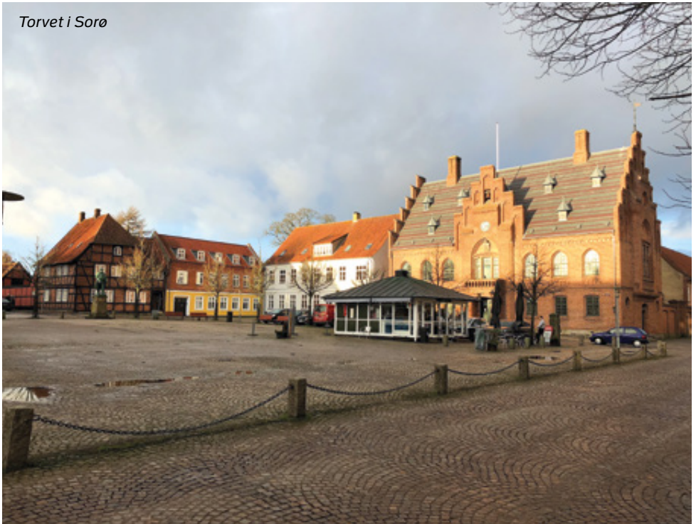
Torvet i Sorø

mue, som Holberg opbyggede, og som skulle tilfalde Akademiet efter hans død, hurtigt voksede. Holberg fik tildelt titlen som baron, som tegn på at han havde samlet sig megen ejendom og formue. Holbergs døde i 1754, og hans sarkofag står i Sorø Kloster kirke.