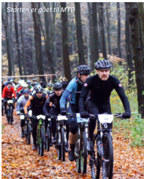
Starten er gået til MTB

Såfremt man som Slagelse MTB rytter møder "fremmede" ryttere på vores spor, kan man ved dialog gøre opmærksom på, at det ikke er tilladt at køre der uden medlemskab. Det er dog helt frivilligt, og det skal understreges, at klubben og dens medlemmer ikke har pligt til det. I sagens natur er det et anliggende mellem den pågældende og skovejeren. Oftest kan en positiv dialog hjælpe den/de afvegne på rette vej igen.