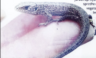
Markfirbenets unge er 5-6 cm lang og har fra starten af de typiske "øjepletter" langs kroppen.

Markfirbenet er afhængigt af at kunne sole sig til varmen. Firbenene er aktive på dage, hvor de kan have deres kropstemperatur til omkring 25-35 grader. Jo varmere de er, des hurtigere bevæger de sig, og jo lettere kan de fange deres bytte eller undgå selv at blive spist.