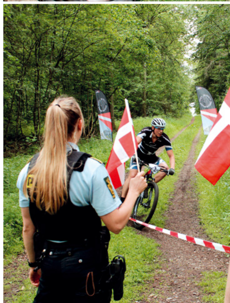
DPIF arkivfotos fra DPM i mountainbike 2019