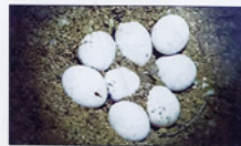
Her er markfirbenets æg vist uden det nødvendige dække af sand. Æggene er meget sart, de skal have varme og fugt for at klækkes. De er 10 - 15 mm lange, men optager vand under udviklingen, så de til sidst er ca. 20 mm på den lange led.

Markfirbenet er blevet sjældent i Danmark. Mange af de tidligere levesteder på overdrev og heder er forsvundet under plov eller groet til. Grusgrave og