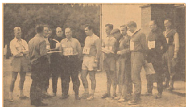
Et hold af de deltagende politiojeblik samlet foran Skørping borger- og Revilskole klædt til afrejse til og til afrejse inde i skoven, hvor den orienteringsløbet starter.