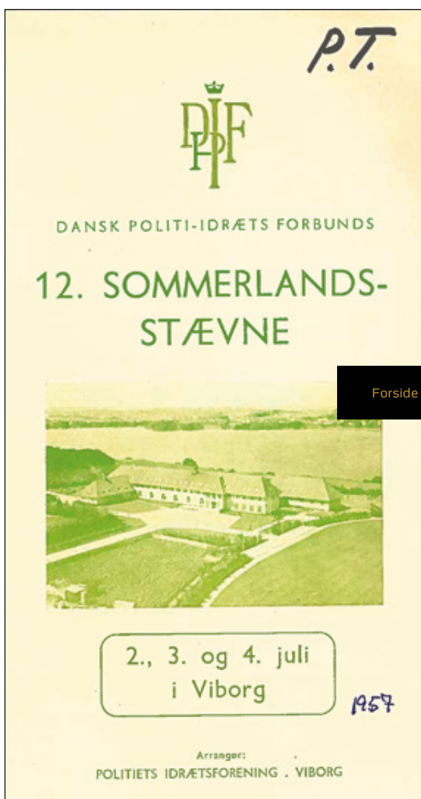
Forside og program 1957