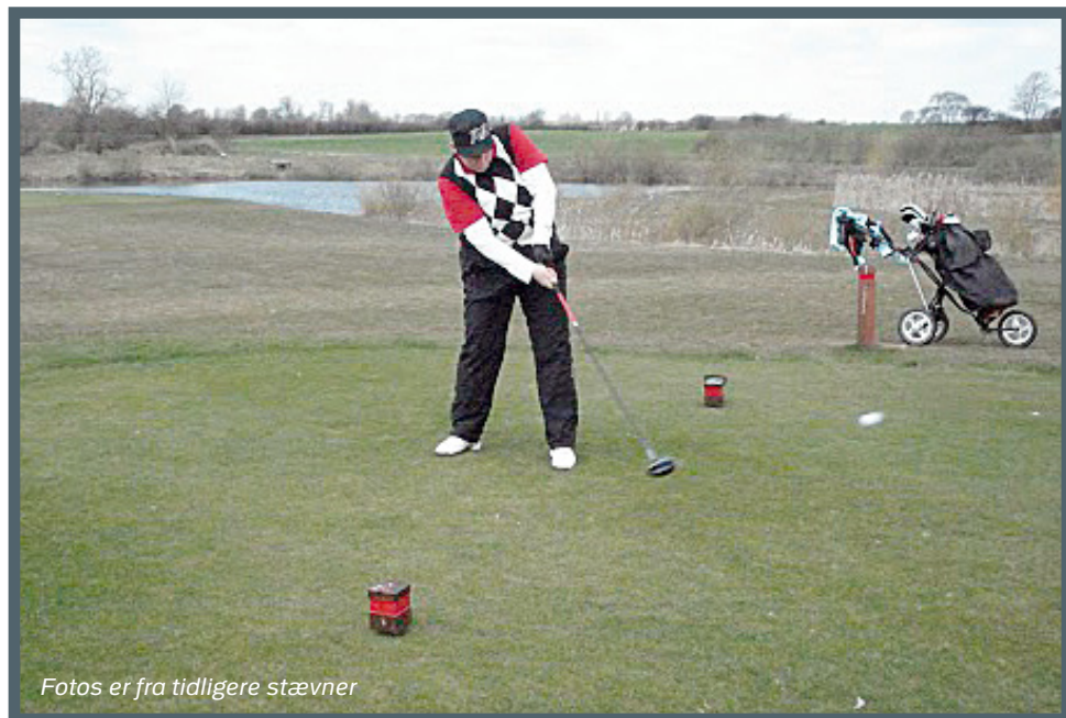
Fotos er fra tidligere stævner