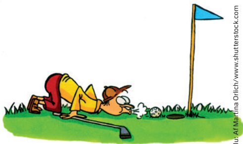
Illu. Af Martina Orlich/www.shutterstock.com

ikke må spilles. Alle slag med den provisoriske bold, inden den blev opgivet (herunder slag og eventuelle strafslag fra spil udelukkende med den provisoriske bold) tæller ikke, eller