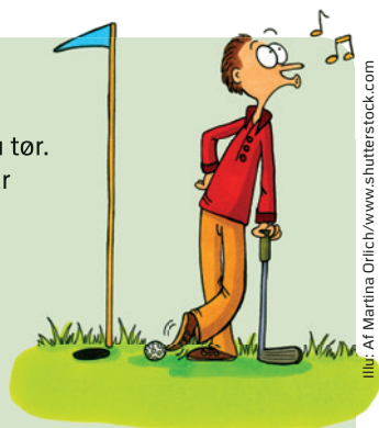
Illustration af Martina Orlich/www.shutterstock.com

Hul 18: Pas på fairwaybunkere. 200 m til den venstre, 230 m til den højre.