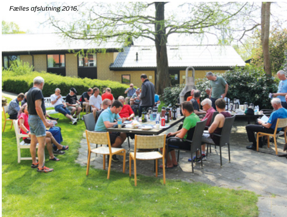
Fælles afslutning 2016.