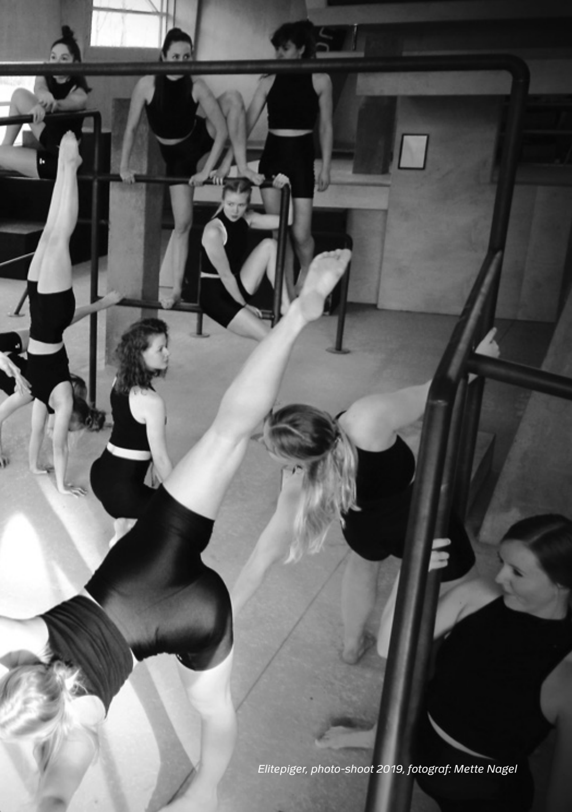
Elitepiger, photo-shoot 2019