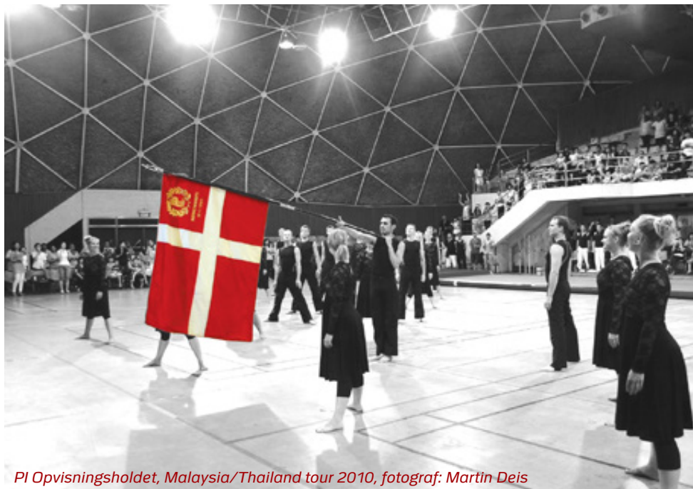
PI Opvisningsholdet, Malaysia/Thailand tour 2010, fotograf: Martin Deis

Vi er så glade for at vi endelig – efter to års pandemi og to aflysninger – igen kan afholde vores traditionsrige og årlige PI Opvisning og byde gymnaster, dansere, instruktører, venner af foreningen og alle andre interesserede velkommen.