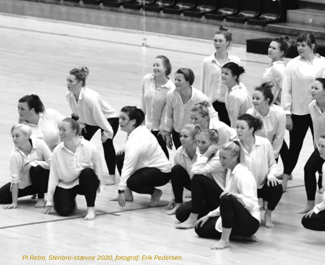
PI Retro, Stenbro-stævne 2020

optegnelser kom ideen om at genoplive "Opvisningsholdet" efter foreningens besøg på Gerlev Idrætshøjskole. Og måske var der også lidt regional konkurrence indover. For ved et af Dansk Politiidræts Forbunds sommerstævner var der gymnastikopvisning ved Århus PI – og så kunne København ellers få liv i kludene igen. Et nyt Opvisningshold så dagens lys i slutningen af 50'erne, og holdet deltog i opvisninger rundt omkring i landet, herunder sommerstævner, Ollerup-stævner osv.