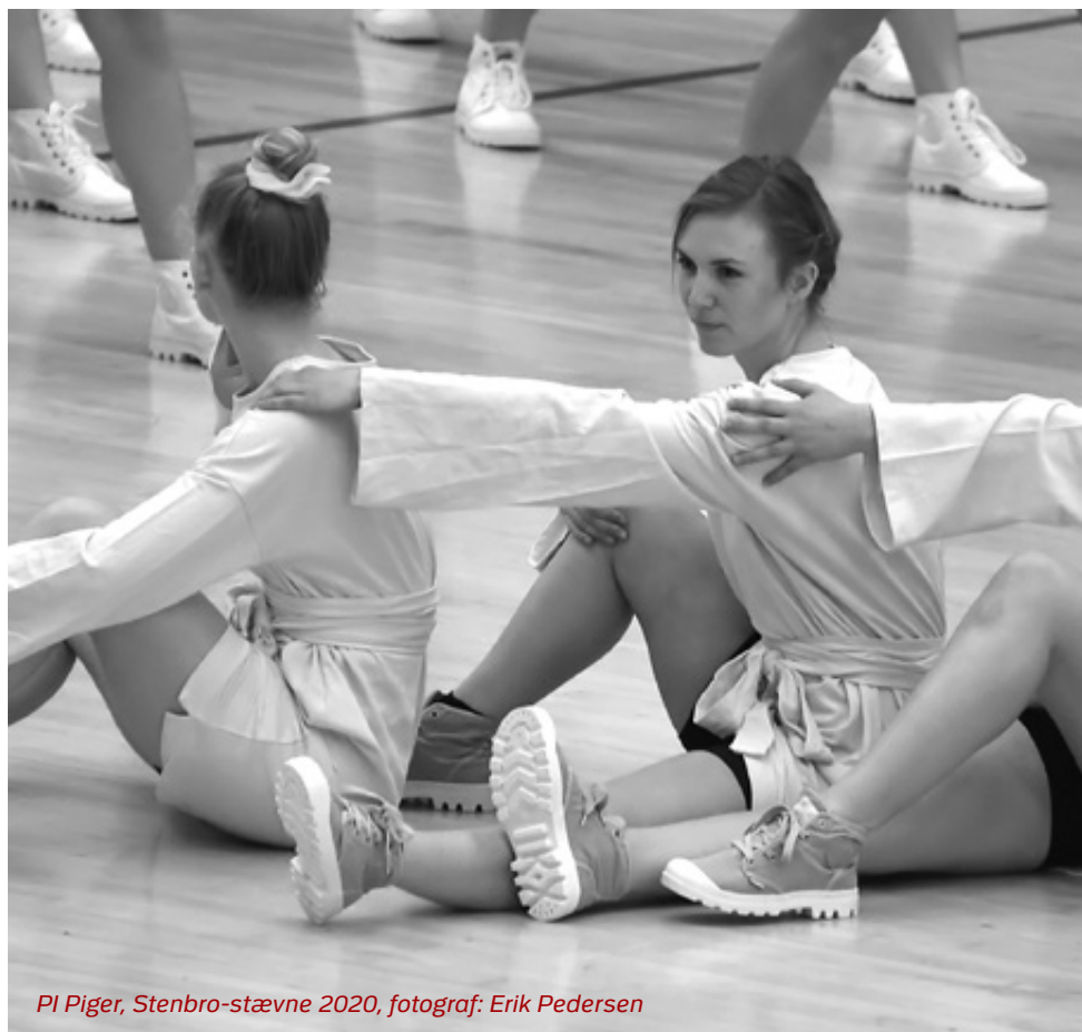
PI Piger, Stenbro-stævne 2020, fotograf: Erik Pedersen