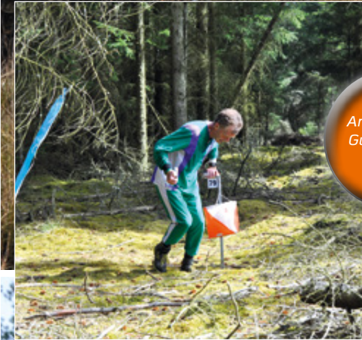
Arkivfotos fra Gudenåløbet 2017