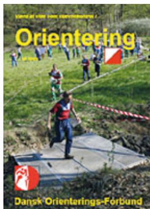
Værd at vide som stævnekontrollant