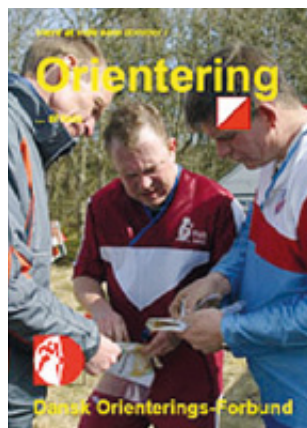
Værd at vide som dommer