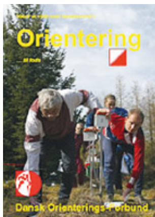
Værd at vide som banekontrollant