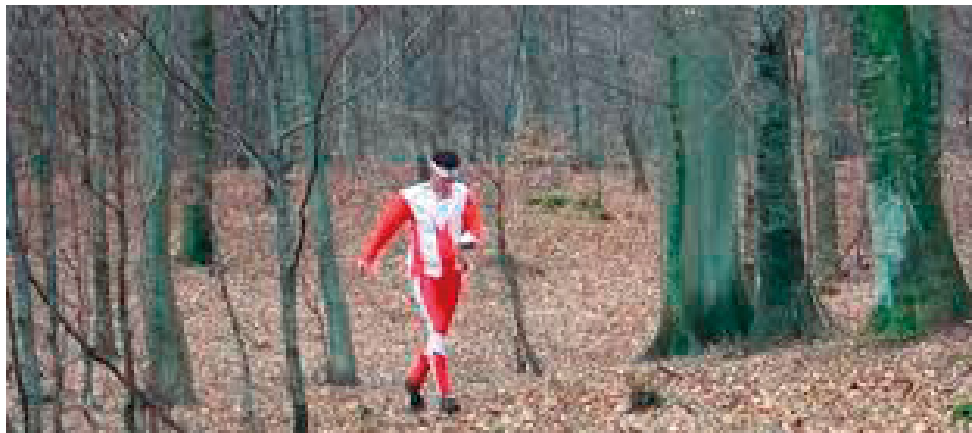
Turen i Stenholt Indelukke. (8 km)

Parforce jagt var en selskabsjagt, som foregik til hest og med hunde. Når hundekoblet havde "stillet" en hjort (d.v.s. udmattet den, så den ikke kunne løbe længere), kom kongen eller jagtens fornemste gæst og "fangede den af" (stak den ihjel) med sin hirschfänger, et kort jagtsværd. Mindestenen for Søren Kierkegaard er rejst i 1913 på hans 100 års dag af National Forfatterforening. Han var en af de få, der i 1800 tallet brugte Gribskov som udflugtsmål til "rekreation og erindringens sysse", og han beskriver i sin bog: "Stadier på Livets Vej", hvordan han brugte dette sted til meditation og eftertanke