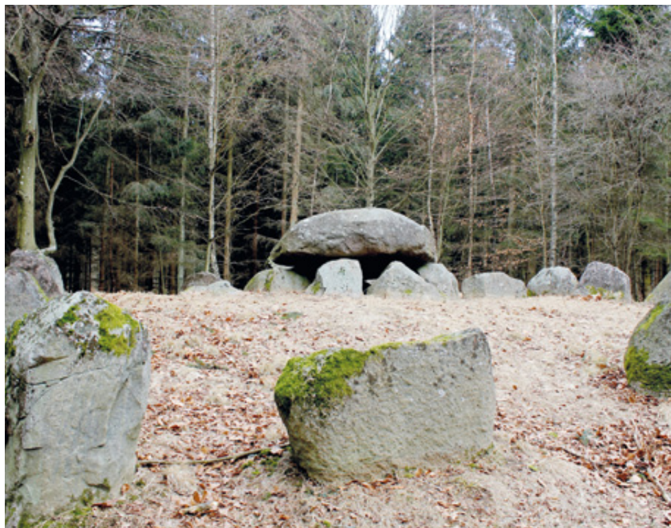
Wiki Loves Monuments 2011, Valby Hegn Langdysser 5-1.