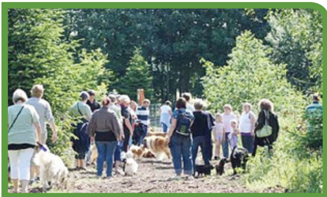
I hundeskoven kan du møde andre hunde og deres ejere

Indkørsel fra Fåborgvej, følg skiltet ved vejen. P-pladser langs med hundeskovene på venstre side af grusvejen. Indgang på højre side af grusvejen. Hundeskoven er hegnet og har kun 1 indgang. Der er agilityredskaber spredt fordelt i skoven, samt bænke. I hundeskoven er der en mindre indhegning der er forbeholdt hvalpe (2-6 mdr.). Husk at du skal have din hund i snor i resten af området ved kolonihaverne.