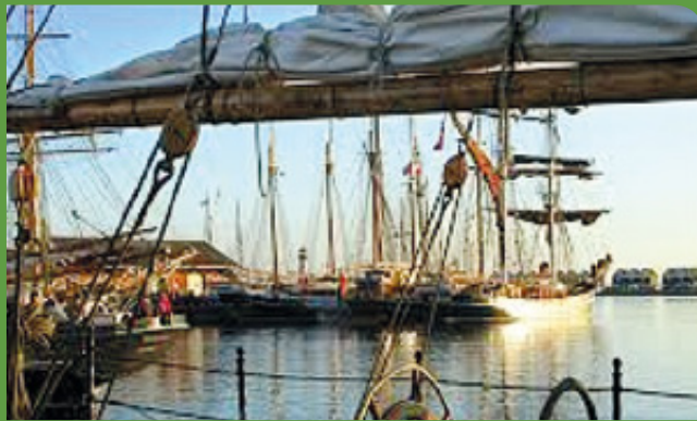
Sejlskibe i Assens havn

Søhelten Peter Willemoes fødehjem, hvis historie går tilbage til 1600-tallet