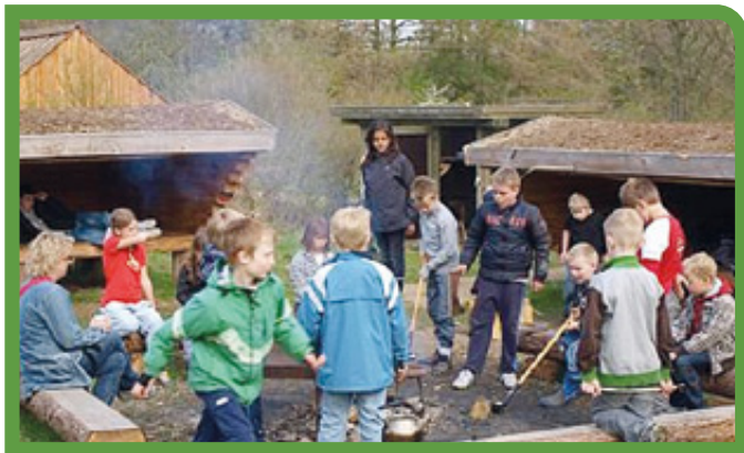
Bålhygge i Brunebjerg

I madpakkehuset finder du en kasse med materialer og gode ideer til, hvad du kan foretage dig i området. I den vestlige del af området er der en lille æbleplantage med gamle danske æblesorter – du er velkommen til at smage på æblerne.