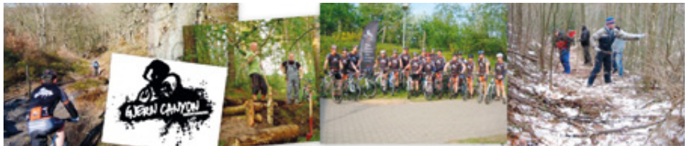
Billede fra spordag.