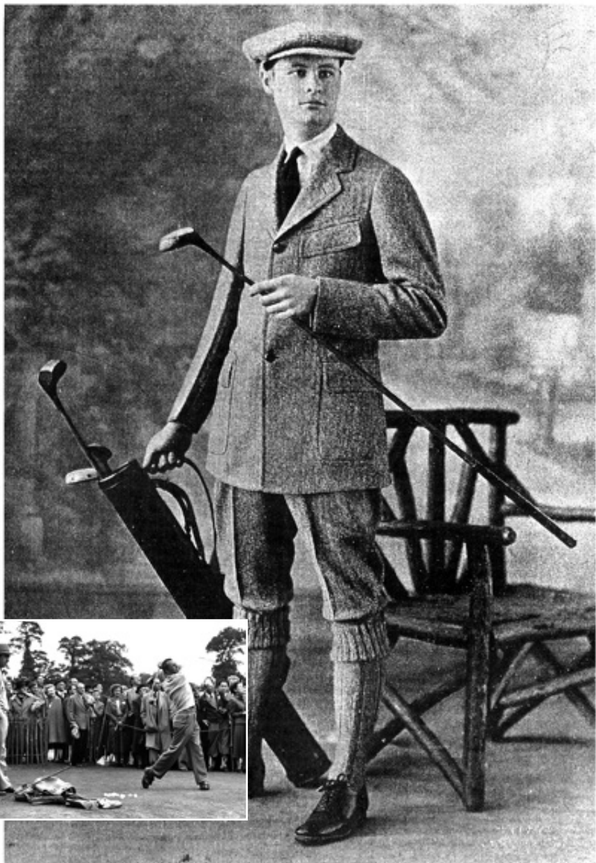
A Tweed Golf Suit Fall, 1915

OldMagazineArticles.com (an American Magazine Ad, 1915)