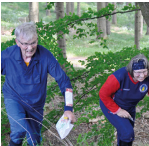
Fotos fra Aalborg og Randers PI's 2-dages arrangement