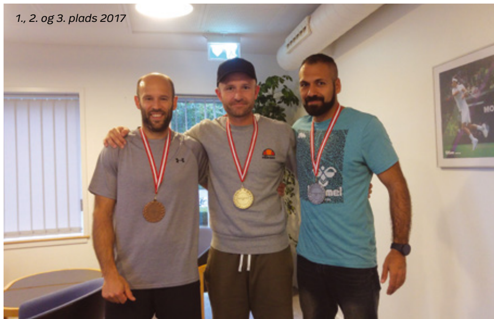
1., 2. og 3. plads 2017

En stor tak skal lyde til Allshirts.dk, som havde en stand med gode tilbud og kyndig vejledning til deltagere og til Lån & Spar Bank som hovedsponsor samt selvfølgelig Dansk Politidrætsforbund.