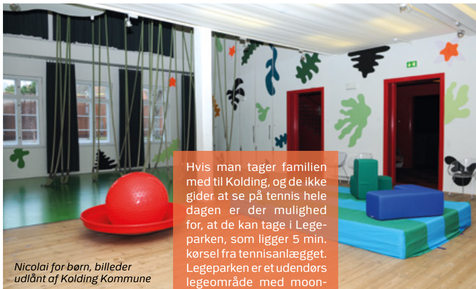
Nicolai for børn, billeder udlånt af Kolding Kommune

Hvis man tager familien med til Kolding, og de ikke gider at se på tennis hele dagen er der mulighed for, at de kan tage i Legeparken, som ligger 5 min. kørsel fra tennisanlægget. Legeparken er et udendørs legeområde med moon-cars, vandcykler og stor legeplads.