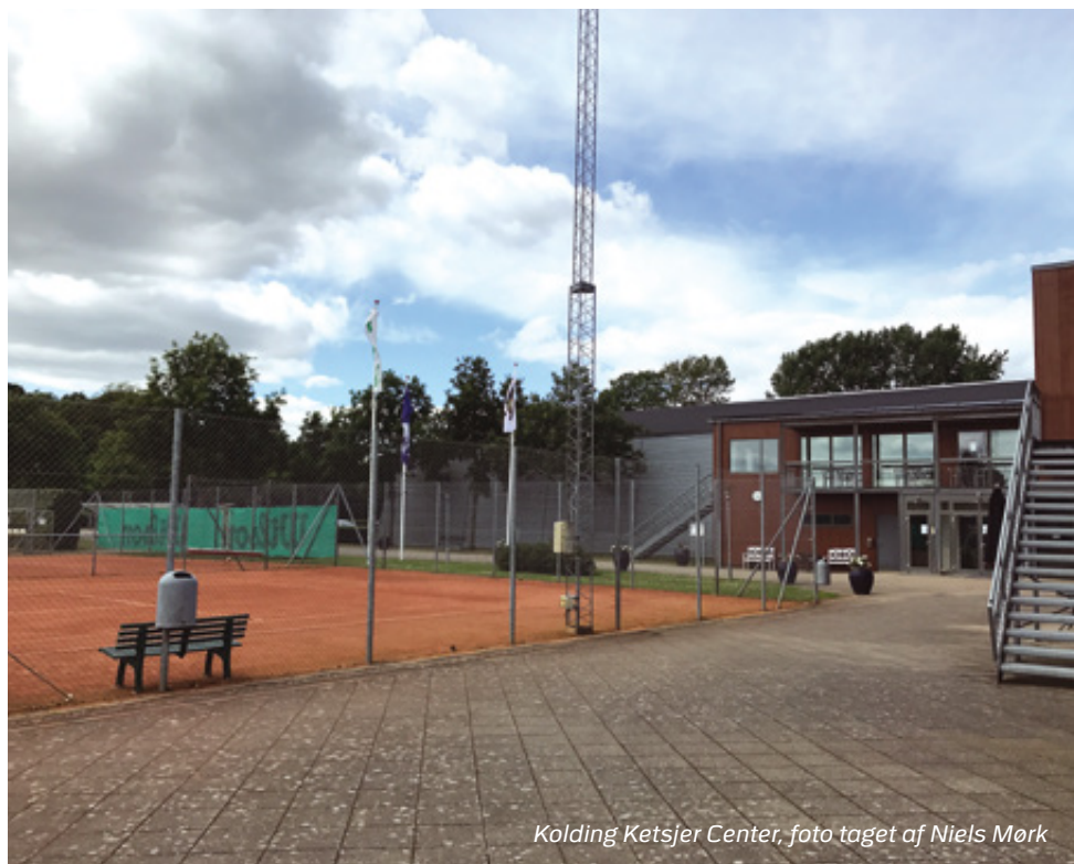
Kolding Ketsjer Center