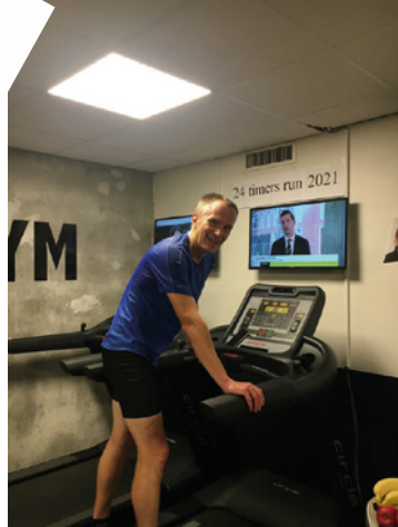
1 mål – 8 km på 30 min.