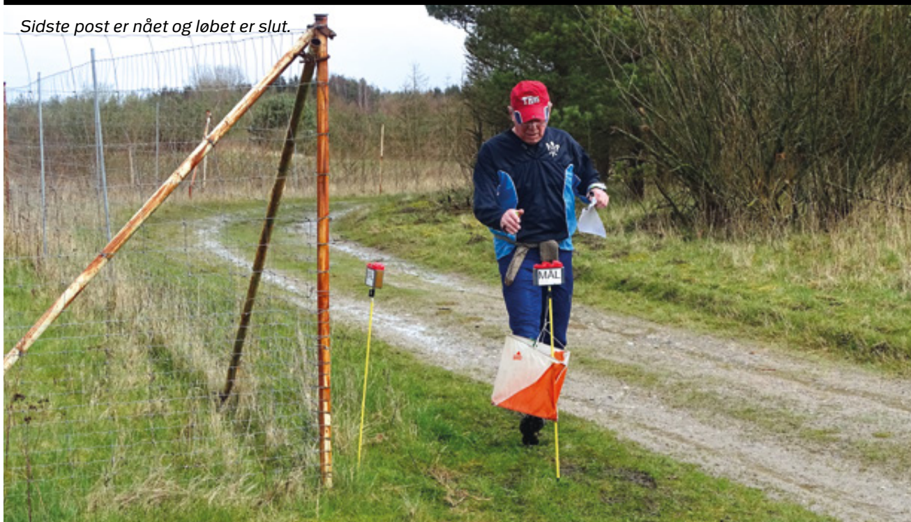
Sidste post er nået og løbet er slut.