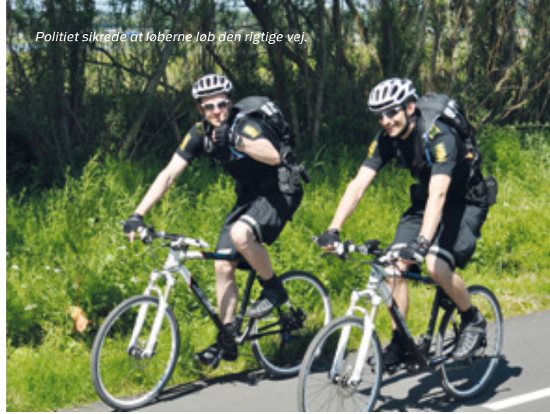
Politiet sikrede at løberne løb den rigtige vej.