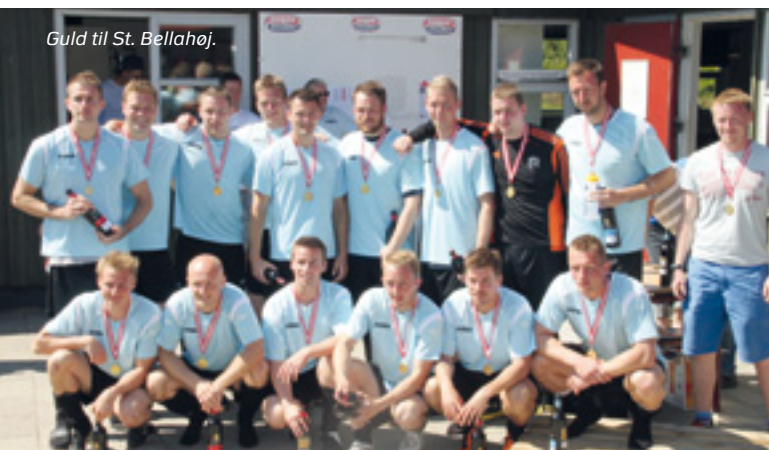
Guld til St. Bellahøj.