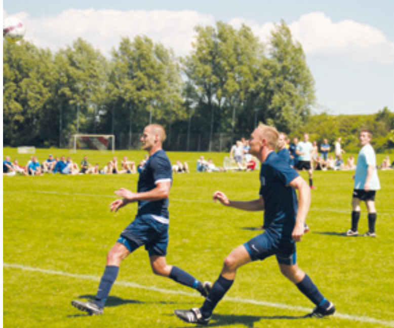
Finalen mellem Østjylland og Bellahøj.