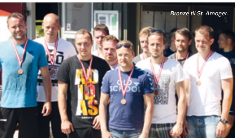
Bronze til St. Amager.

På fodboldudvalgets vegne, skal der lyde en stor tak til idrætsforeningen ved Østjyllands politi, som havde lavet et flot arrangement med godt vej og Red Bull-piger.