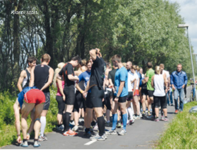
Klar til start.