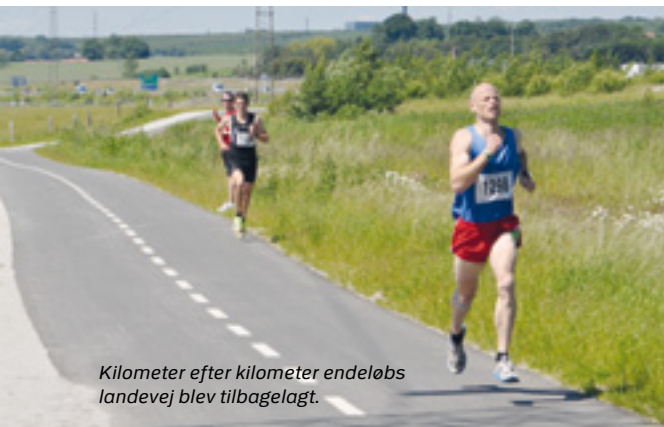
Kilometer efter kilometer endeløbs landevej blev tilbagelagt.