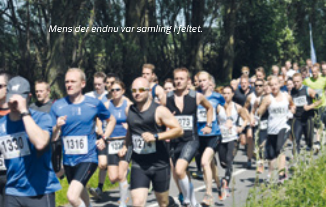
Mens der endnu var samling i feltet.