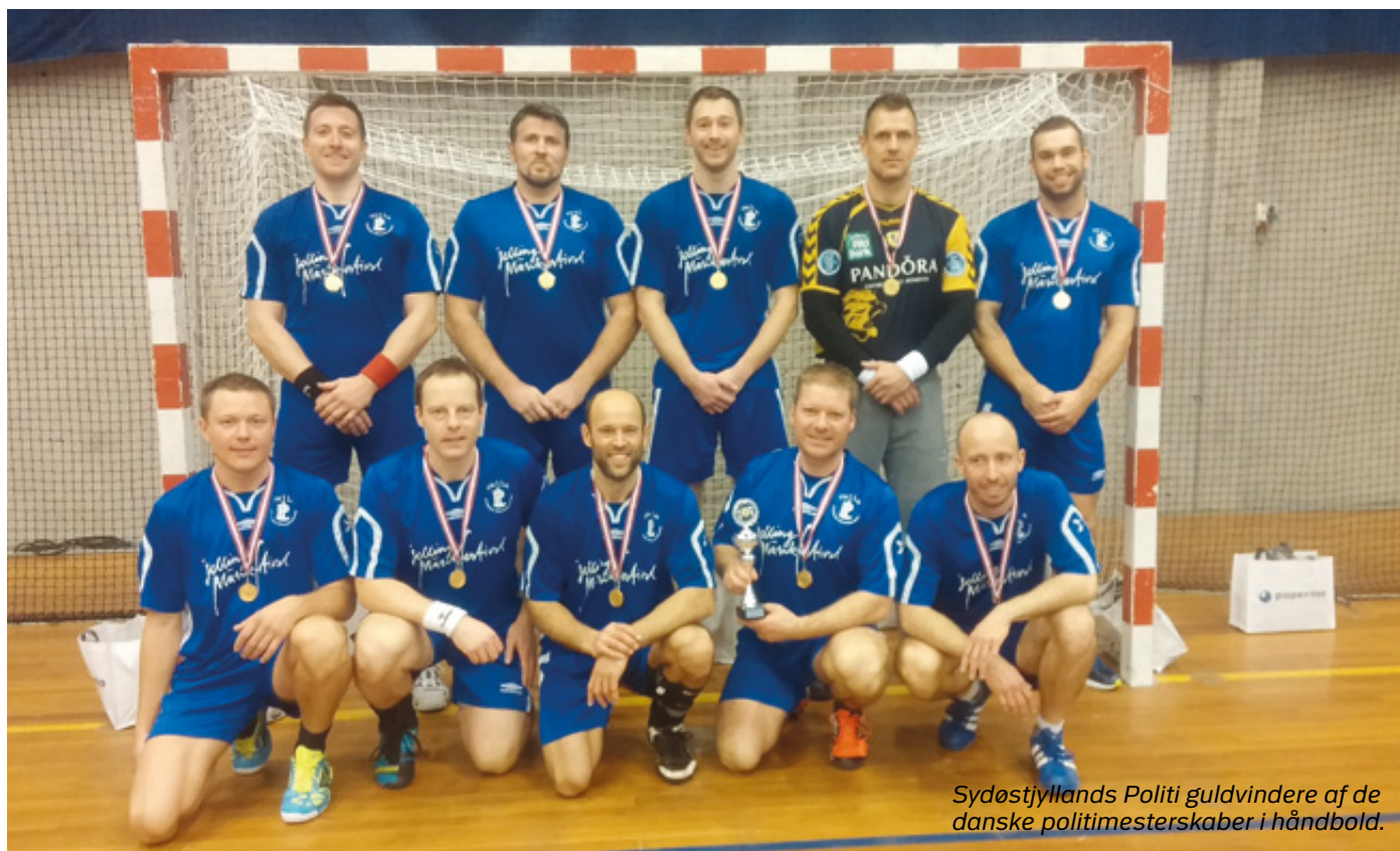
Sydøstjyllands Politi guldvindere af de danske politimesterskaber i håndbold.