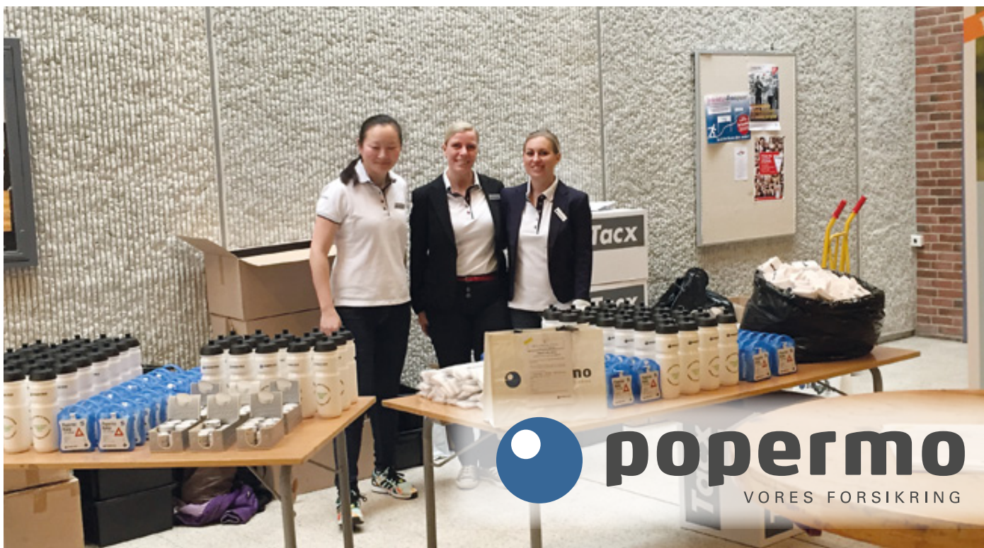
Af Ole K. Jacobsen, DPIF