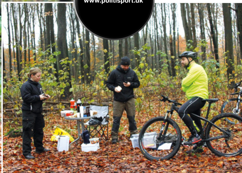
Inden længe går starten for næste rytter.