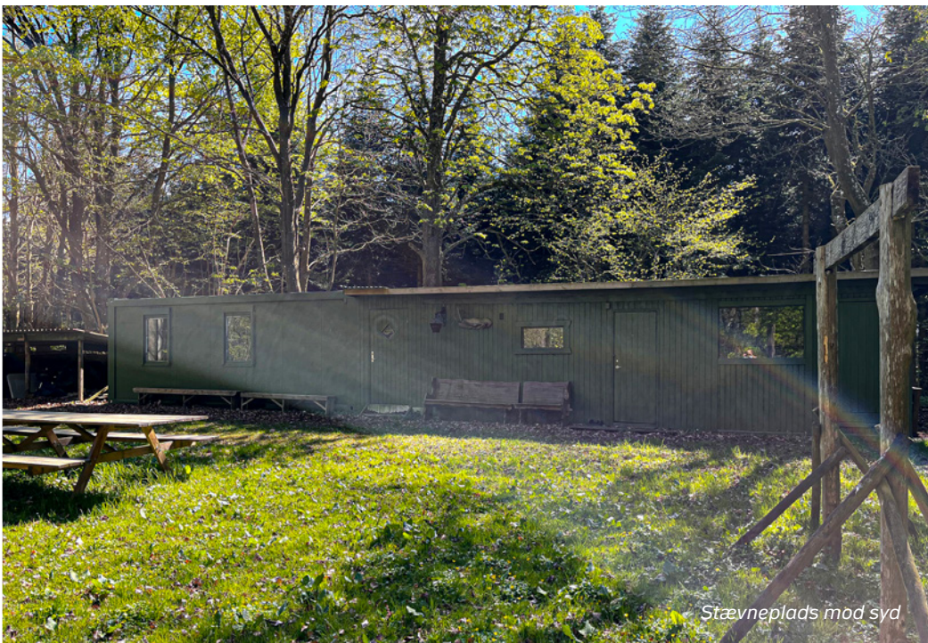
Stævneplads mod syd